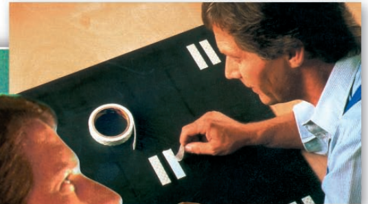
Przyklejanie luster (taśma 4026)