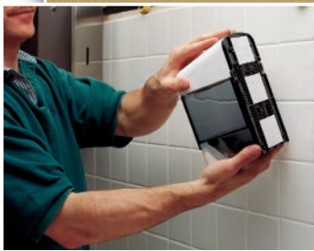
Przyklejanie dyspensera (taśma 9540)