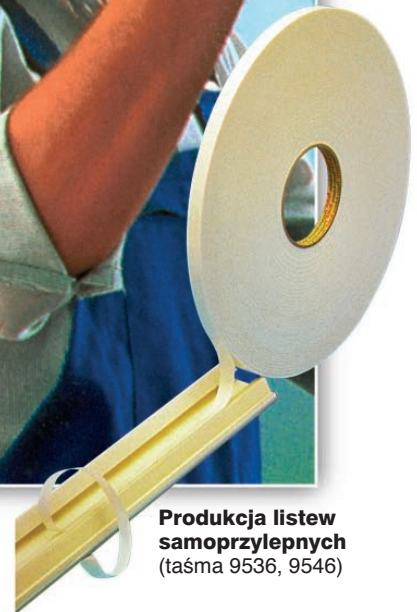
Produkcja listew samoprzylepnych (taśma 9536, 9546)