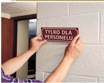
Przyklejanie tabliczek z opisami (taśma 9529, 9536)