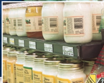
Przyklejanie listew cenowych do regałów sklepowych (taśma 9528, 9536)