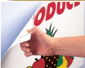
Tymczasowe mocowanie plakatów reklamowych (taśma 4658F)